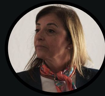
Gabriela Quartino (Uruguay)

Aidéé está convencida de que es el centro del mundo. Cree que todos están pendientes de lo que hace o deja de hacer, que todos hablan de ella a sus espaldas, que su traslado a la fiscalía de la frontera es parte de una conspiración en su contra. Esto la lleva indefectiblemente a convivir con un profundo resentimiento que expresa sobre todo contra el fiscal general y que no le permite disfrutar de cosas buenas que pueden estar pasándole. Es de temperamento impulsivo, hace lo que le parece en cada momento sin dudar de sí misma. La vida le va a demostrar que no es más que una simple mortal, como el resto del mundo. El tema es si está dispuesta a aceptarlo.