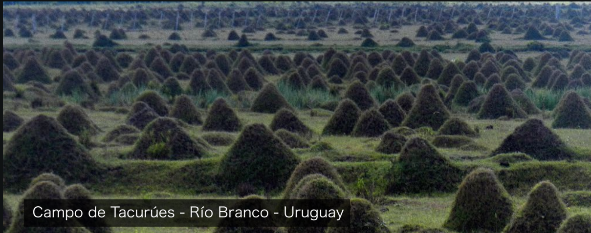
Campo de Tacurúes - Río Branco - Uruguay