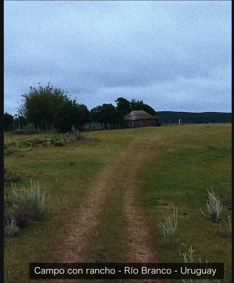
Campo con rancho - Río Branco - Uruguay