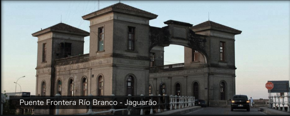
Puente Frontera Río Branco - Jaguarão